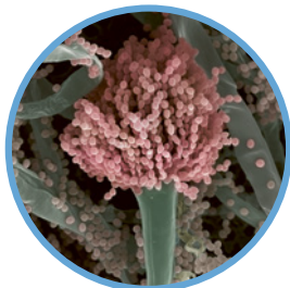
Elektronenmikroskopische Aufnahme des Schimmelpilzes Aspergillus fumigatus , der in der Natur weit verbreitet ist.

Die Hyposensibilisierung ist die einzige Behandlung, die an der Wurzel der allergischen Reaktion ansetzt und ihre Symptome langfristig verbessern kann. Dabei soll sich das Immunsystem durch regelmäßige Injektionen des Allergens unter die Haut langsam daran gewöhnen. Der Behandlungszeitraum beträgt drei bis fünf Jahre.